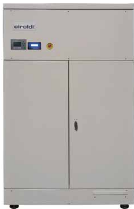
Polverizzatore ceneri SUPERIOR ad alta velocità.