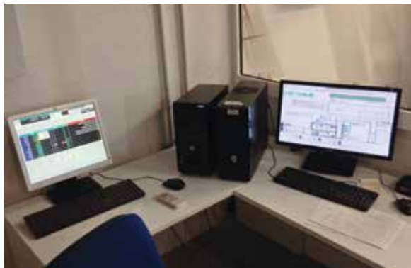
Sistema di gestione forno e supervisione in remoto tramite modem.