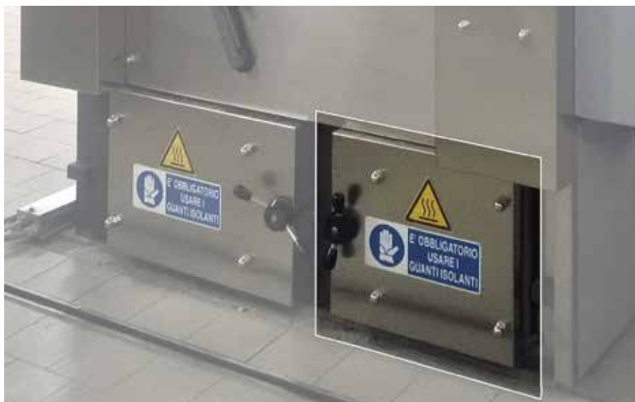
Sistema di recupero dello zinco

CIROLDI S.p.A. con sede a Modena (Italia), da cinquant'anni opera nella progettazione, costruzione e installazione d'impianti per la termodistruzione e termovalorizzazione di diverse tipologie di rifiuti solidi, organici e industriali. A complemento degli impianti di cui sopra, relativamente ai quali annovera centinaia di referenze in Italia e nel mondo, anche grazie alla notevolissima esperienza in questo ambito acquisita, ha sviluppato un'articolata gamma d'impianti per la cremazione di salme e resti mortali nonché di animali da compagnia, le cui peculiarità sono rappresentate da solidità, compattezza, elevato livello tecnologico e funzionale, piena rispondenza alle più restrittive normative in campo ambientale.