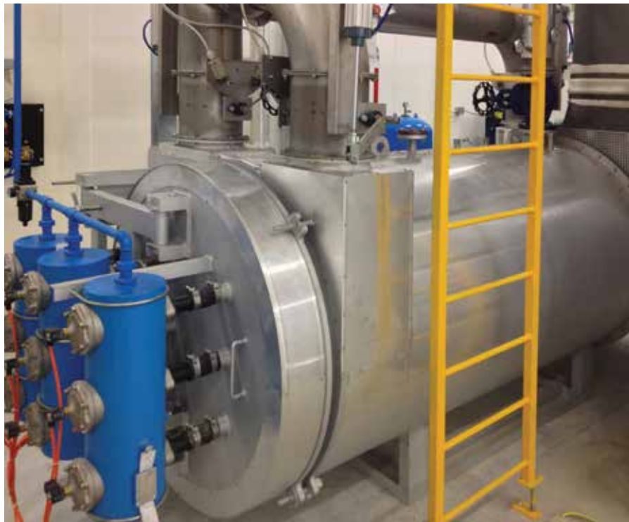
Sistema recupero termico